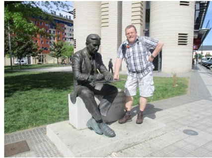
Ponferrada, Stadt der Tempelritter.